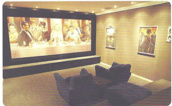
Im Partyraum befindet sich ein Heimkino mit 3D-HD-Projektor, Dolby Surround und Multiformat-Großbildleinwand, die auf Cinemascope-, 16:9- oder 4:3-Format angepasst werden kann.

auch für die Kinder ein Paradies ist, da sich Spielekonsolen und Wiis an das System anschließen lassen. In allen Räumen befindet sich mindestens ein mobiles oder in der Wand verbautes, intelligentes Bedientastenfeld, über das nicht nur die Beleuchtung und Rollos auf Fingertipp bedienbar sind, sondern sie beinhalten auch Thermostatfühler zur Regelung der Raumtemperatur, LED-Beleuchtung und integrierte Audiowiedergabe zur Wahrnehmung der Türklingel oder von Warnmeldungen. In den Gängen und dem Treppenhaus befinden sich Bewegungs- und Lichtsensoren und sorgen für eine