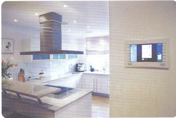
In allen Räumen befindet sich mindestens ein mobiles oder in der Wand verbautes, intelligentes Bedientastenfeld.