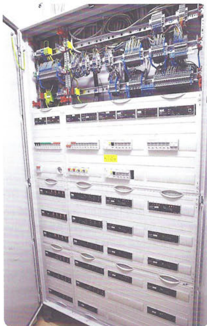
Im Keller befinden sich auch die einzelnen, miteinander vernetzten Module für die Haussteuerung. Eine moderne Unterverteilung.

Home-Entertainment inklusive Audio- und Videoserver, auf denen sämtliche Musikstücke und Filme gespeichert sind und zwei Fernseher mit Blockbustern versorgt. Im Keller befinden sich auch die einzelnen, miteinander vernetzten Module für die Haussteuerung: Eine moderne Unterverteilung mit elf Dimmermodulen und 44 Dimmkreisen zur individuellen Lichtsteuerung. Acht Relaisblöcke mit 88 Schaltkreisen für Steckdosen, Leuchten und Jalousien sowie für die Regelung der Fußbodenheizung. Zur Realisierung der zahlreichen Komfortfunktionen kommt Technik von Crestron, dem Hersteller intelligenter Haussteuerungen, zum Einsatz.